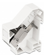
Anwendungsbeispiel mit Stecker