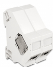
Anwendungsbeispiel mit Stecker