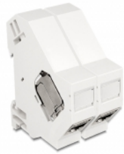
Anwendungsbeispiel mit Stecker