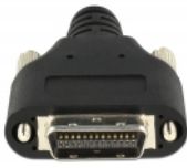
MDR 26 Pin