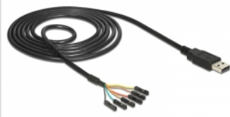
ca. 1,8 m