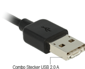
Combo Stecker USB 2.0 A